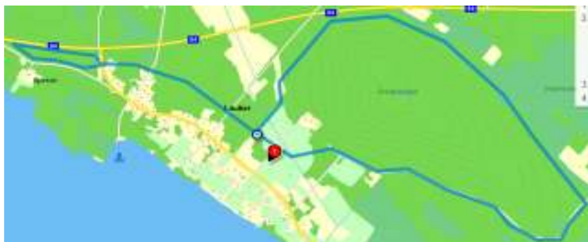
Kartbild över bansträckningen

Dragning av priser på startnummer sker efter att starten gått och dragningslista sätts därefter upp i byastugeentrén.